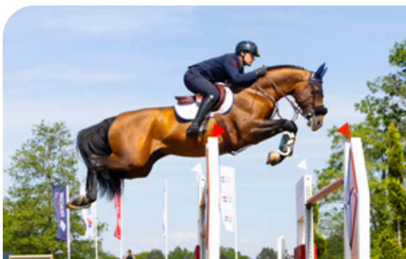
GASPAHR Berlin x Tangelo van de Zuuthoeve