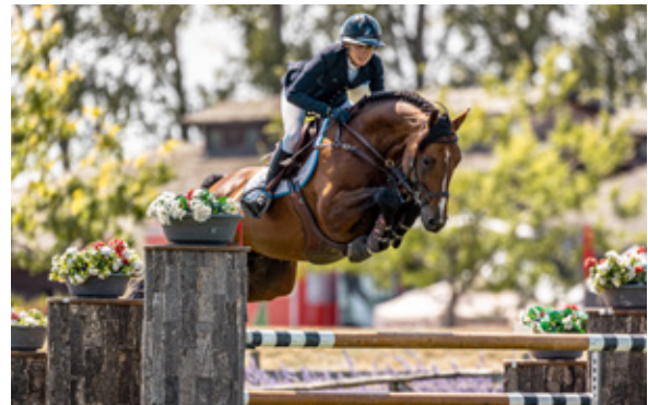
FARZACK DES ABBAYES Montender x Flipper D'Elle