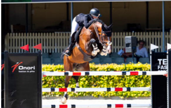
NEWMARKET VM Chaccoon Blue x Numero Uno