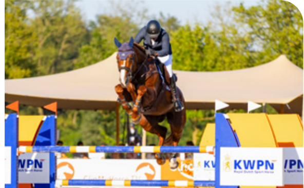
A MOONLIGHT SPECIALE Z P 30 Aganix du Seigneur x Chacco-Blue