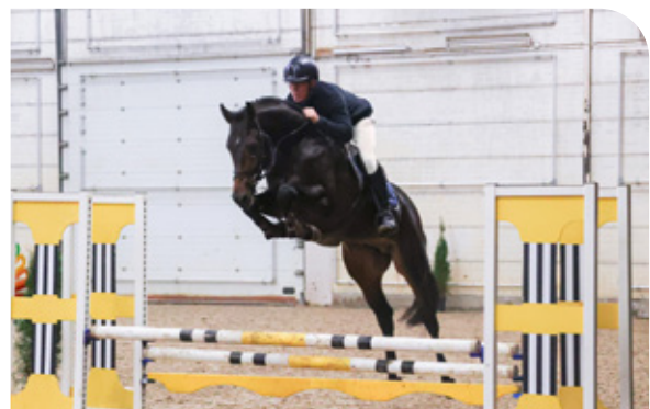
RAMAZOTTI VD WATERMOLEN P 40 United Touch S x Dakar VDL