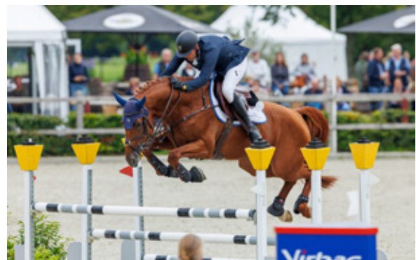
LAMBRUSCO Entertainer x Lux Z