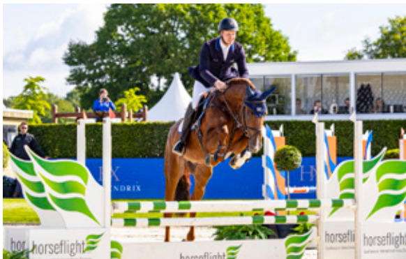
DINELLO Dinken x Corrado I