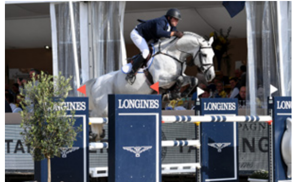
CAPE CORAL RBF Z Cornet Obolensky x Argentinus