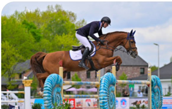
ENTERTAINER Warrant x Corland