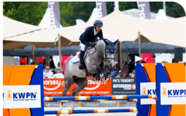
PAGANI OF THE PADDOCKS P 34 Catoki x Corofino I