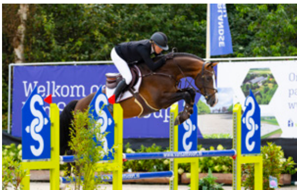
PINACOLADA VAN SELDSUM P 38 Dominator Z x Namelus R