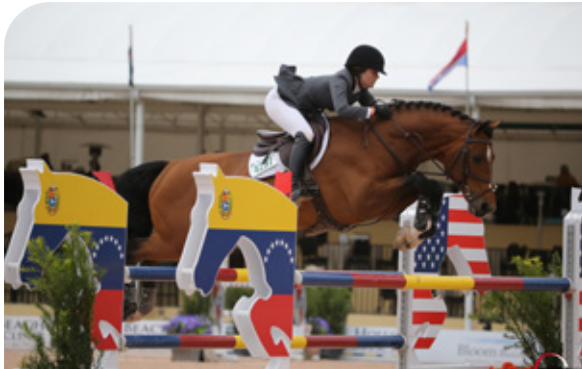
BUSTIQUE Indoctro x Grannus